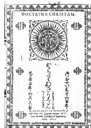
The title page of "DOCTRINA CHRISTAM" published in 1600 from Bensei Publishing

Ang sikat na kristyanong lider pyudal na si Takayama Ukon (1552-1615) ay nagsagawa ng matatag na pundasyon na nakatulong sa pagpatayo ng Simbahan Katolika. Siya ay kilalang isang karaniwan lider na aktibo noong kalagitnaan ng ika-16 na siglo kung saan ang bansang hapon ay nasa digmaang sibil. Nakilala ni Ukong ang mga misyonerong Heswita at siya ay naging Katoliko sa edad na 12 kasabay ang kanyang ama na si Dario. Siya ay isang aktibo at pinagkakatiwalaang utusan ni Oda