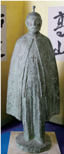
Bronze statue of Ukon (by Yasutake Funakoshi, The Museum of the 26 Martyrs in Nagasaki)

Ang taong tinahak ang landas ng pagka masunurin Justo Takayama Ukon (1552-1615)