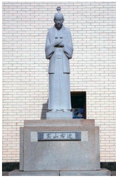
Stone statue of Ukon (by Masayoshi Abe, Cathedral of Osaka)

na tatahakin bilang isang lingkod ng Panginoon. Sa gitna ng kaguluhan na halos ang lahat ay nais umangat sa taas, pinili niyang magpakumbaba. Sa mga pagkakataon na kung saan ay kailangan niyang pumili ng landas na tatahakin, pinili pa rin niya ang buhay mahirap nguni't may kaligayan sa kanyang puso. Ang landas na kanyang pinili ay patungo kay Kristo, ang pagpasan ng krus, pagpapakumbaba at natagpuan niya ang Panginoon. Ang matibay na pagasa ay naroon. Bilang Kristiyano, batid natin na ang Panginoon ay nagpakumbaba, naghirap para matubos ang sanlibutan. Siya ay umakyat sa langit kasama si Hesus at humarap sa Diyos Ama.