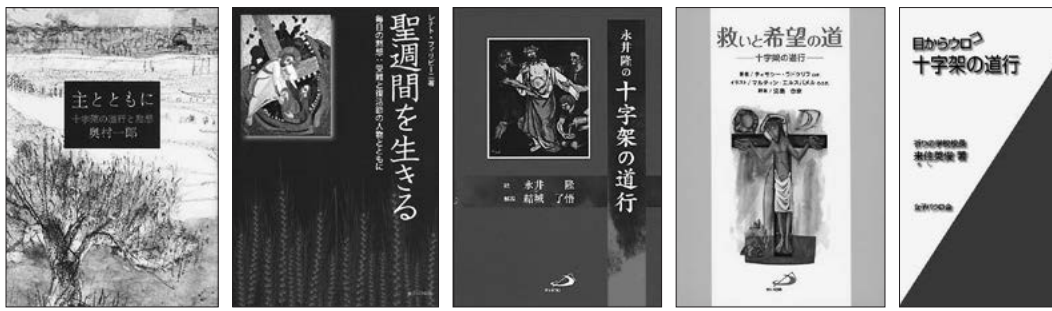
「主とともに」「聖週間を生きる」「永井隆の十字架の道行」「救いと希望の道」「目からウロコ 十字架の道行」

3月2日の「灰の水曜日」から、四旬節が始まります。今年はおうちで静かに黙想してみても如何でしょうか。四旬節におすすめの図書案内をご紹介します。 問合せ 聖パウロ書院 ☎052-936-4443