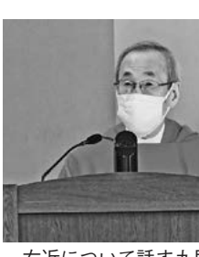
右近について話す九里神父

彼の霊的指導者であるオルガンチーノ神父の「より上のものに仕えるように」の教えを実行し、太閤秀吉に「私はキリストを捨てることはできない。私を好きに